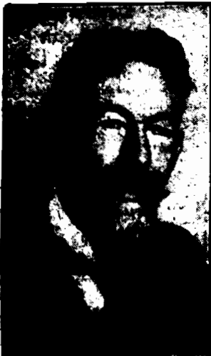
Wiedeński chemik, który otrzymał obecnie nagrodę Nobla.