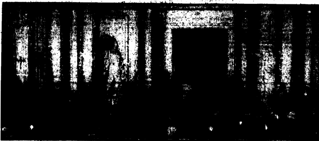
Prezydent Ignacy Mościcki odczytał akt otwarcia sejmów w obecności rządu z premierem Piłsudskim, oraz posłów i senatorów. (Fot. str. 2-a).