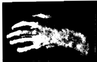
REKA MISTRZA TONÓW

Dziś, jak rzadko kiedy, wobec całego świata możemy być dumni i wzruszeni.