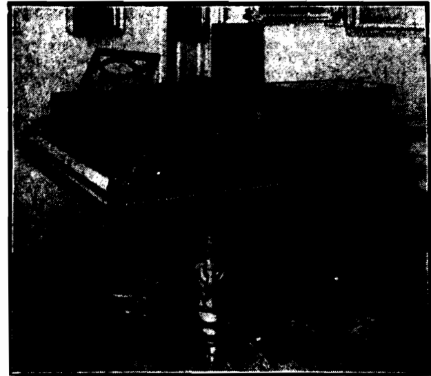
FORTEPIAN, NA KTÓRYM TWORZYŁ CHOPIN.