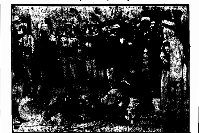
Pomimo protestów francuskich polityków kinematografy amerykańskie wyświetliła czołowy film „Francuska lecja poddaństwa”. Władze rządowe