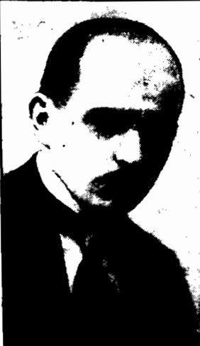
RUDOLF JABŁOŃSKI nowy sekretarz generalny Komitetu Ekonomicznego Ministrów.