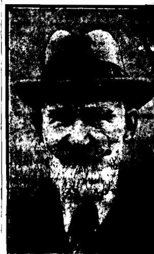
znany pisarz angielski otrzymał obecnie nagrodę Nobla.